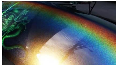
リアルブラックベース