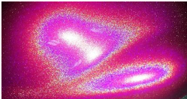
サンシャインレッドベース

この度は Phantom Aurora Space マイクロボトルをお買い上げ頂きましてありがとうございます。 下記マニュアルをよくお読みになりご使用下さい。